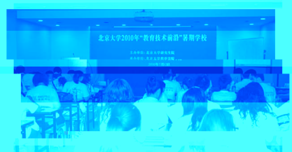
图1 暑期学校开幕式

7月23日，北京大学2010“教育技术前沿”暑期学校顺利落下帷幕。本次暑期学校由北京大学研究生院主办，教育学院承办。本期暑校专业课程主要涵盖教育技术理论研究、信息技术与课程整合、高等教育信息化、企业数字化学习和新技术支持下的教与学等几个板块。本次暑期学校正式录取学员110名，分别来自全国各地64所各级各类高校、企事业单位，主要是研究生和青年教师（约占30%左右），也包括少量高级别本科生和企业人员。在为期两周的课程